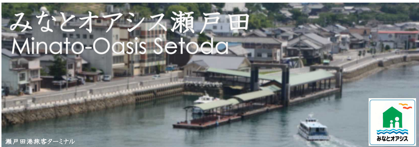
瀬戸田港旅客ターミナル