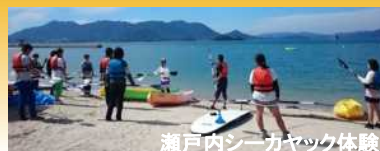
瀬戸内シーカヤック体験