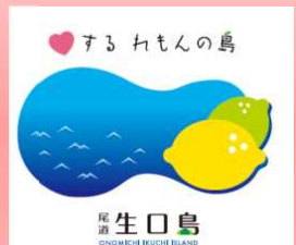
瀬戸田ブランドシンボルマーク