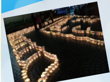
NPO法人ちゃんくす あがりプロジェクト