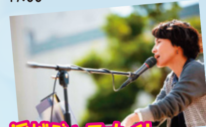
浮城ジャズナイト (ゲストボーカル) うずらさん 18:30~