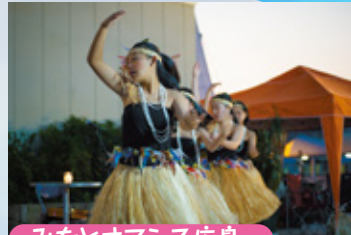
みなとオアシス広島 ハワイアンステージ レイフラワーハッピー 17:00~