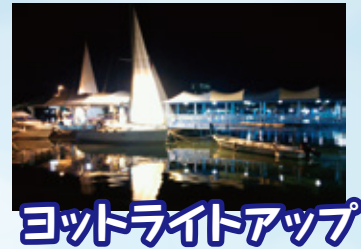
ヨットライトアップ