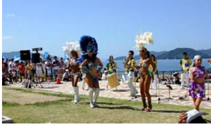
リオ de ビーチカーニバル in ベイサイドビーチ坂