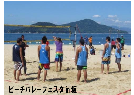
ビーチバレーフェスタ in 坂

また、広島市内から一番近い海水浴場であり、オンシーズン（7～8月）には毎年数万人の海水浴客が訪れ、大変賑わっ