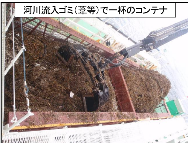
河川流入ゴミ(葦等)で一杯のコンテナ