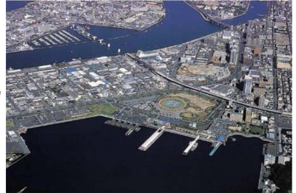
みなとオアシス広島