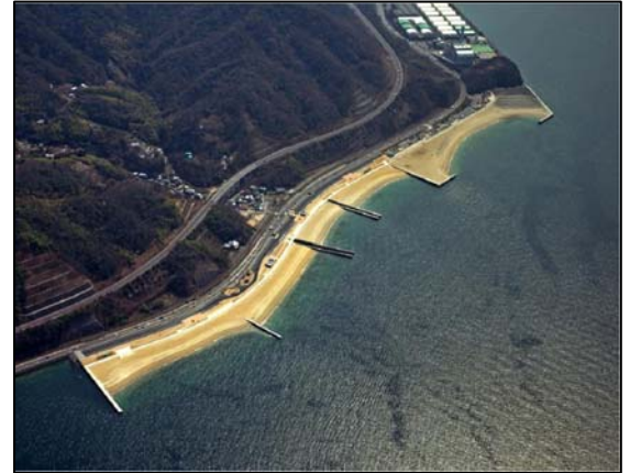
みなとオアシス ベイサイドビーチ坂