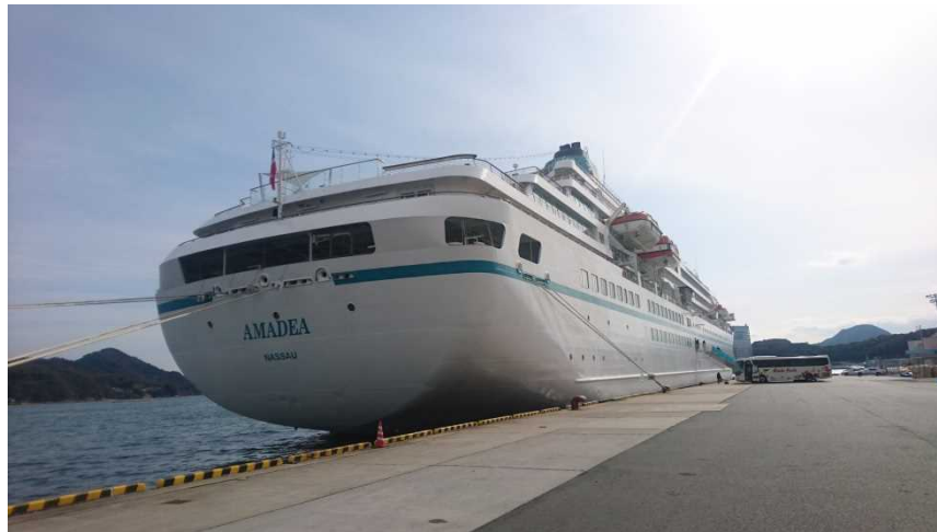
広島港（宇品地区）に停泊するアマデア

2月22日、ドイツのフェニックス・ライゼン社が運航する「アマデア」（総トン数29,008トン）が広島港へ11年ぶり、3回目の寄港を行いました。