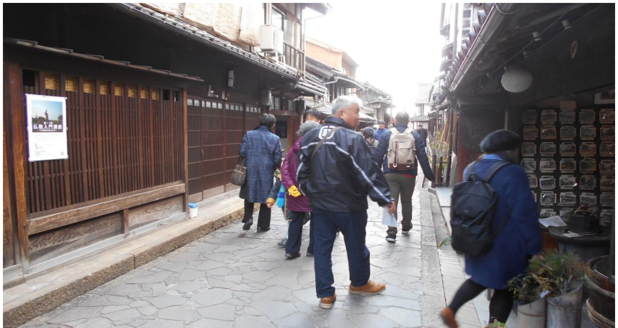
鞆の浦観光の様子