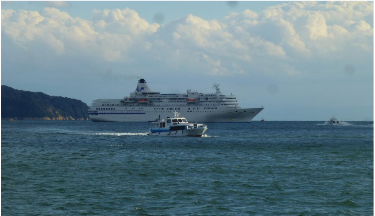
ぱしふいっくびいなす（福山港（鞆の浦沖））

11月24日、日本クルーズ客船が運航する「ぱしふいっくびいなす」（総トン数26,594トン）が福山港（鞆の浦沖）へ寄港しました。広島県福山市鞆の浦へ上陸した約420名の乗客は、鞆の浦の史跡めぐりなどの観光を行いました。