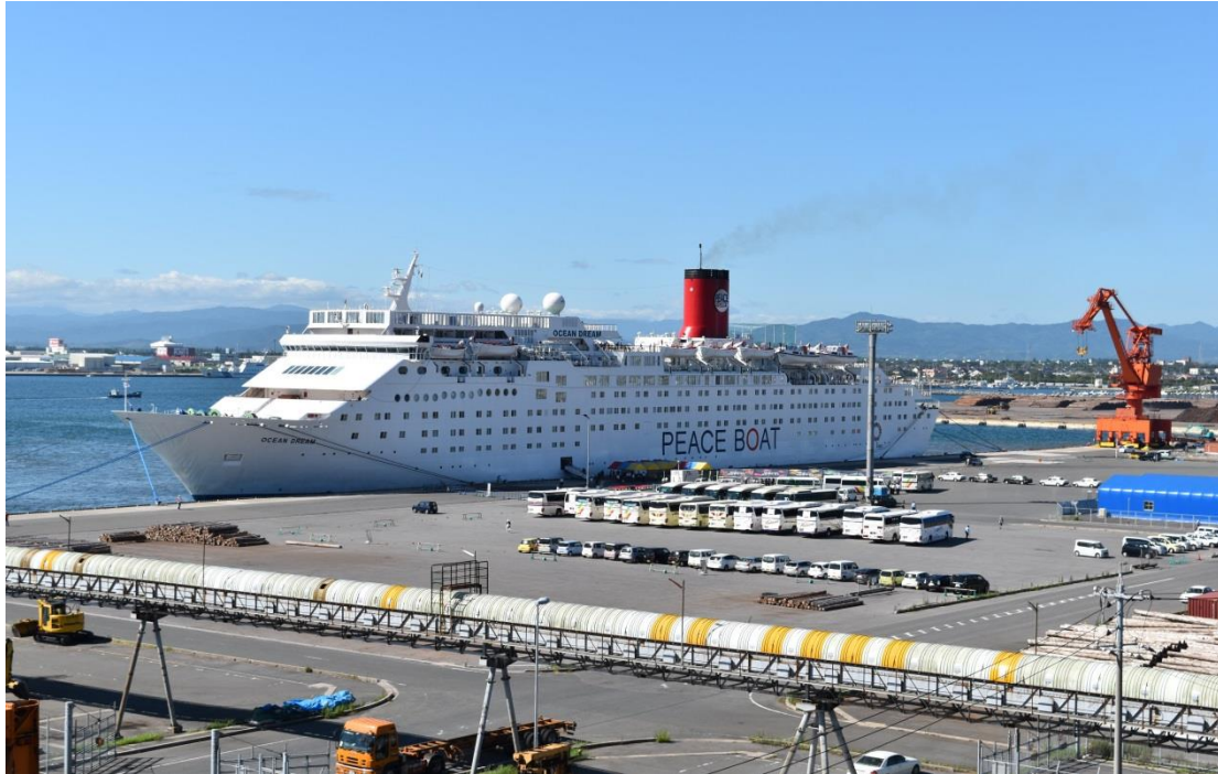
オーシャン・ドリーム（境港）