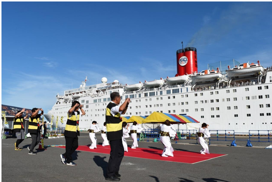
安来節による歓迎