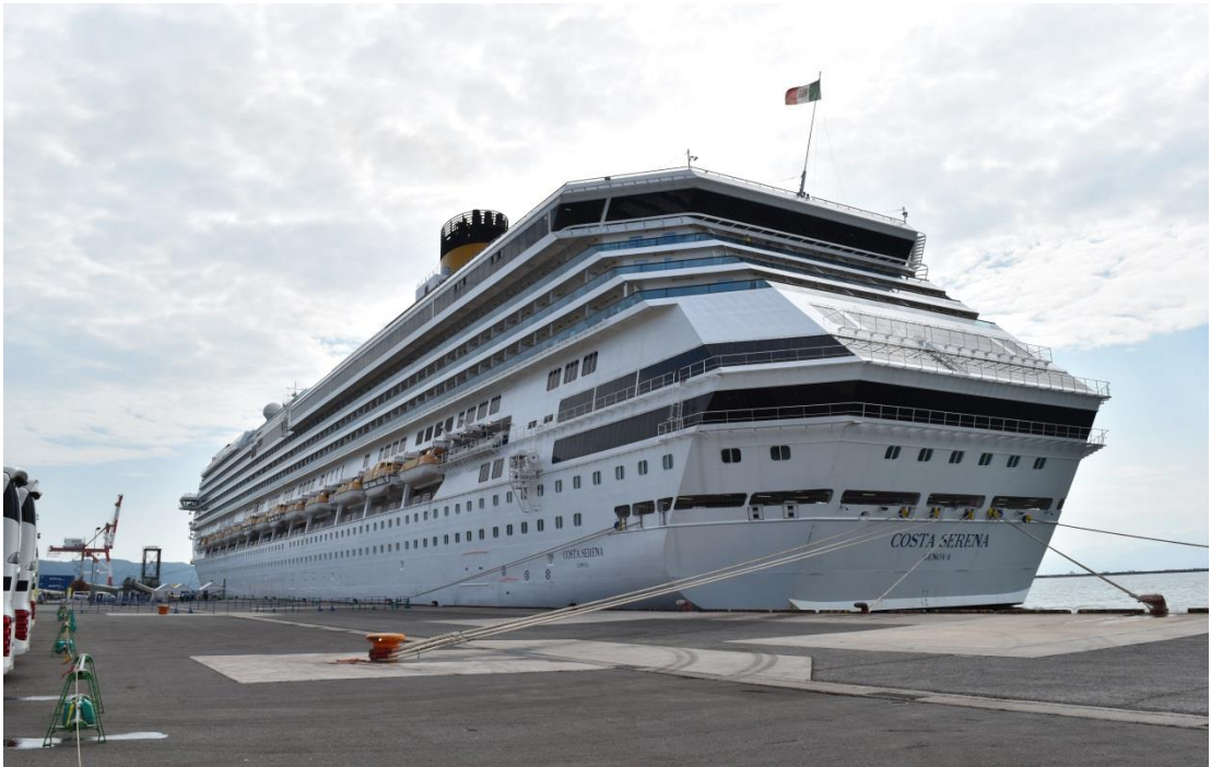
境港に初寄港したコスタ・セレーナ

乗客はツアーバスで松江城や水木しげるロード、大山などで観光を行った後、次港の上海へ出発しました。