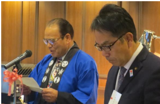
【尾道市長(右)の開会挨拶と三原市長(左)の乾杯】