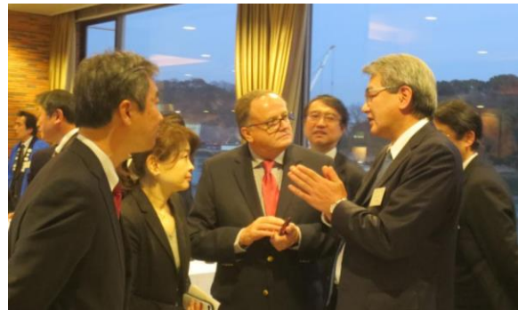
【招聘者を囲んでの交流会】

2日目は、ニーズのマッチングの機会として、個別面談を開催しました。港湾施設の詳細や排水の受入の可否、港から観光地までの移動時間等について具体的な質疑応答がなされました。