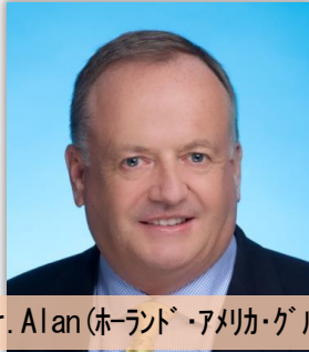
Mr. Alan (ホーランド・アメリカ・グループ)

平成29年1月31日(月)～2月1日(火) グリーンヒルホテル尾道(広島県尾道市東御所町9-1)において、瀬戸内海クルーズに興味をもつ外航クルーズ船社の運航管理等に携わる方を招き、保有船舶の紹介や受入環境に関するニーズを聞くとともに、受入を検討している港の港湾管理者より港湾施設の情報を提供しました。