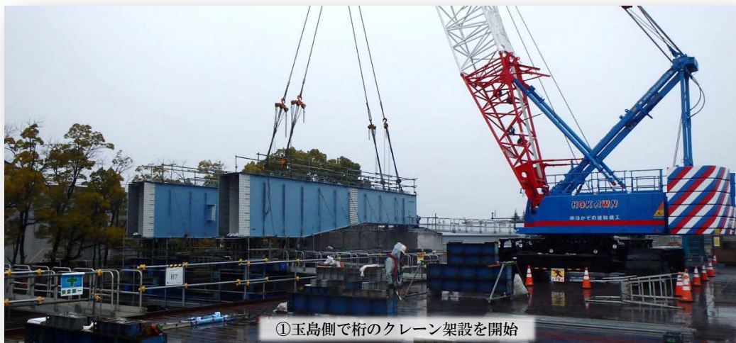
①玉島側で桁のクレーン架設を開始