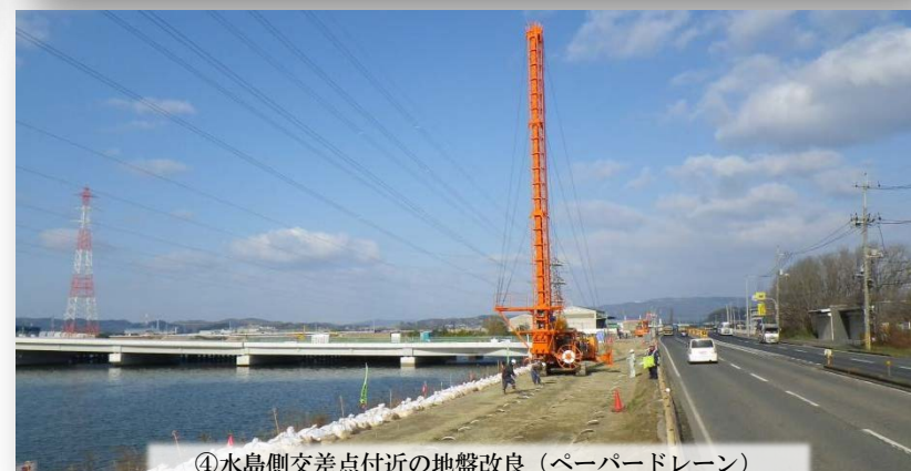
④水島側交差点付近の地盤改良（ペーパードレン）