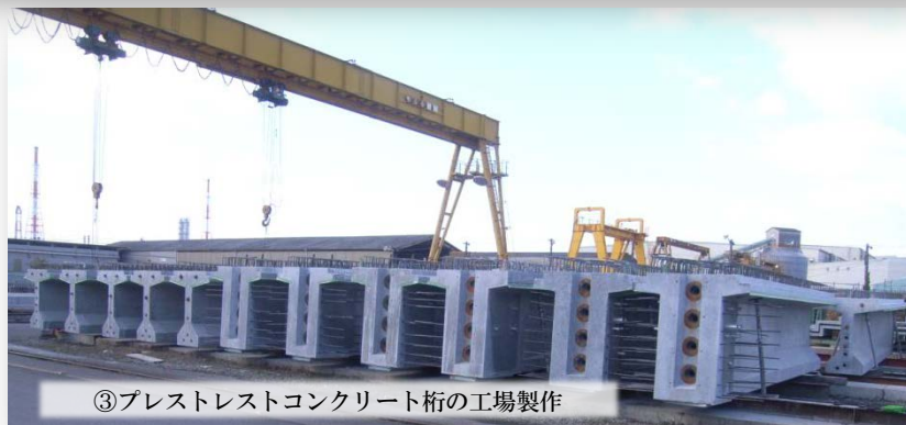
③プレストレストコンクリート桁の工場製作