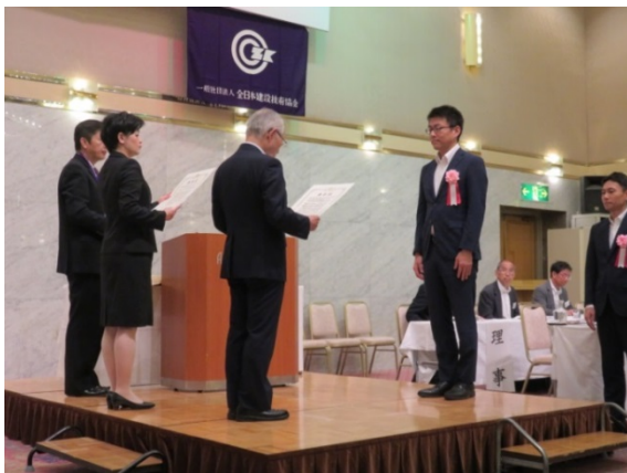
表彰状授与の様子