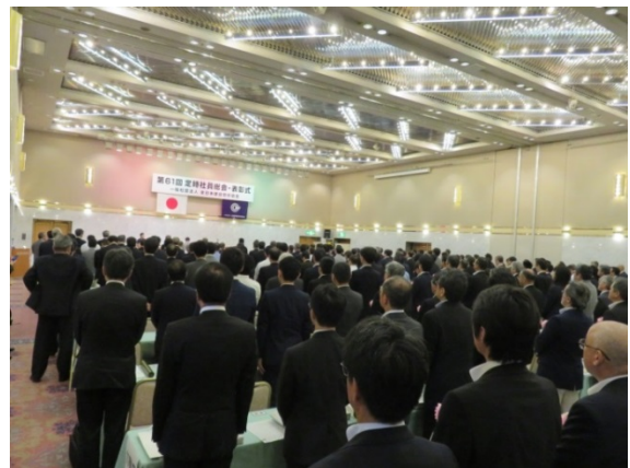
表彰式会場の様子

平成29年度全建賞は、全国から317事業の応募があり、81事業(うち港湾部門9事業)が受賞しました。