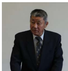
三牧「大島干潟を育てる会」副会長