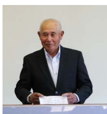
永濱「大島干潟を育てる会」会長