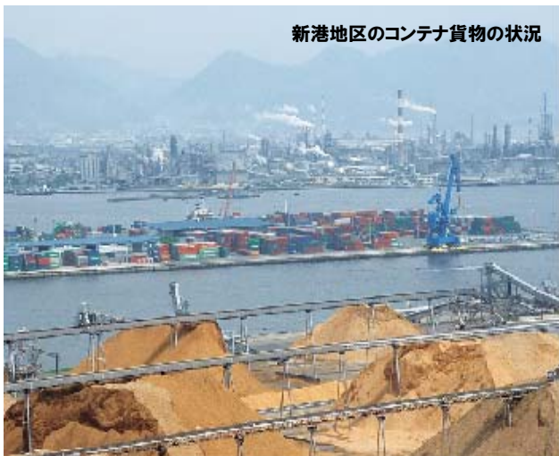
新港地区のコンテナ貨物の状況

現在、岩国港装束～室の木地区を繋ぐ臨港道路の整備を推進しており、延長2.9kmを3区間（Ⅰ期、Ⅱ期、Ⅲ期）に分け、投資効果の早期発現を図るためⅠ期区間を集中的に整備し、平成28年4月にⅠ期区間の暫定供用を開始しました。