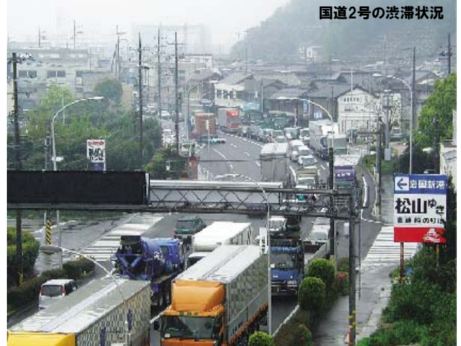
国道2号の渋滞状況