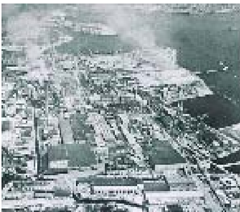
←山陽国策パルプ岩国工場／パルプ工場として東洋一の規模を誇りました。パルプ・洋紙の他、化成品や建材を主要製品としていました。

大正14年に帝国人造絹糸株式会社が起工し、国内最大の人絹工場となったことで岩国は近代工業化の第一歩を踏み出します。麻里布村は町制を布いて支援し、人々の活気ににぎわいました。その他、東洋紡績株式会社・帝人製機・山陽パルプ・興亜石油・三井石油化学などが進出。紡績・製紙・化学品工業では県下第一の生産額を占めるなど、工業都市としての特色を形成しました。