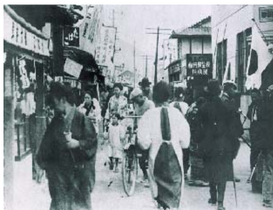
←人絹町のにぎわい／昭和2年から帝国人造絹糸株式会社岩国工場が操業を開始。麻里布村は人絹工場に大きい期待をかけ、援助をつきました。