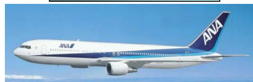
B767-300 ● 航続距離 3,370km ● 座席数 216席・279席