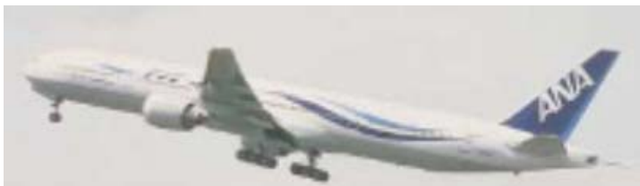
B777 ● 航続距離 4,300km・4,500km ● 座席数 405席～524席