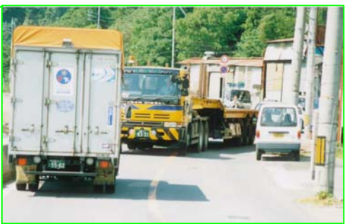
既存のアクセス道は住宅地を通過し、狭隘でトレーラーの通行困難