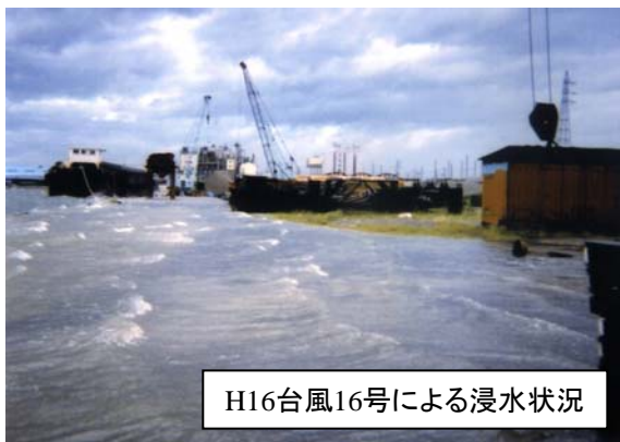
H16台風16号による浸水状況