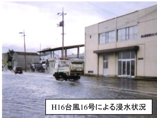
H16台風16号による浸水状況