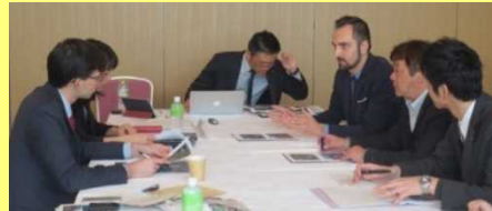
外航船社の運航担当者と港湾管理者との個別面談

招聘者：ホーランド・アメリカ・グループ 船舶運航副社長 ウィンドスター・クルーズ 事業開発/運航計画担当マネージャー