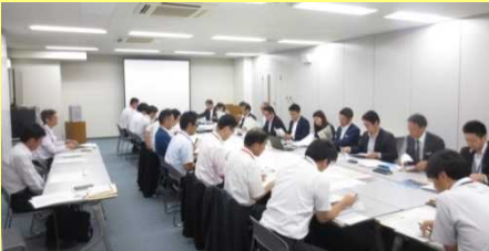
内航船社と港湾管理者との意見交換