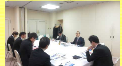
船社と自治体の個別面談