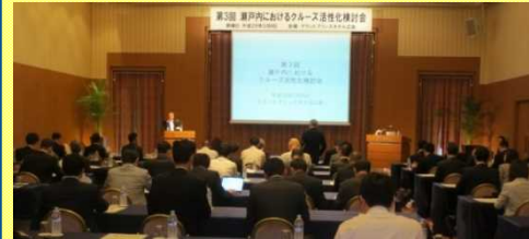
外航船社、内航船社等による講演会

招聘者：(株)カーニバル・ジャパン 代表取締役社長 (株)せとうちクルーズ 代表取締役社長