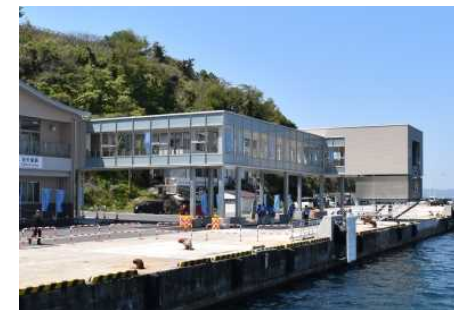
ギャングウェイの全景