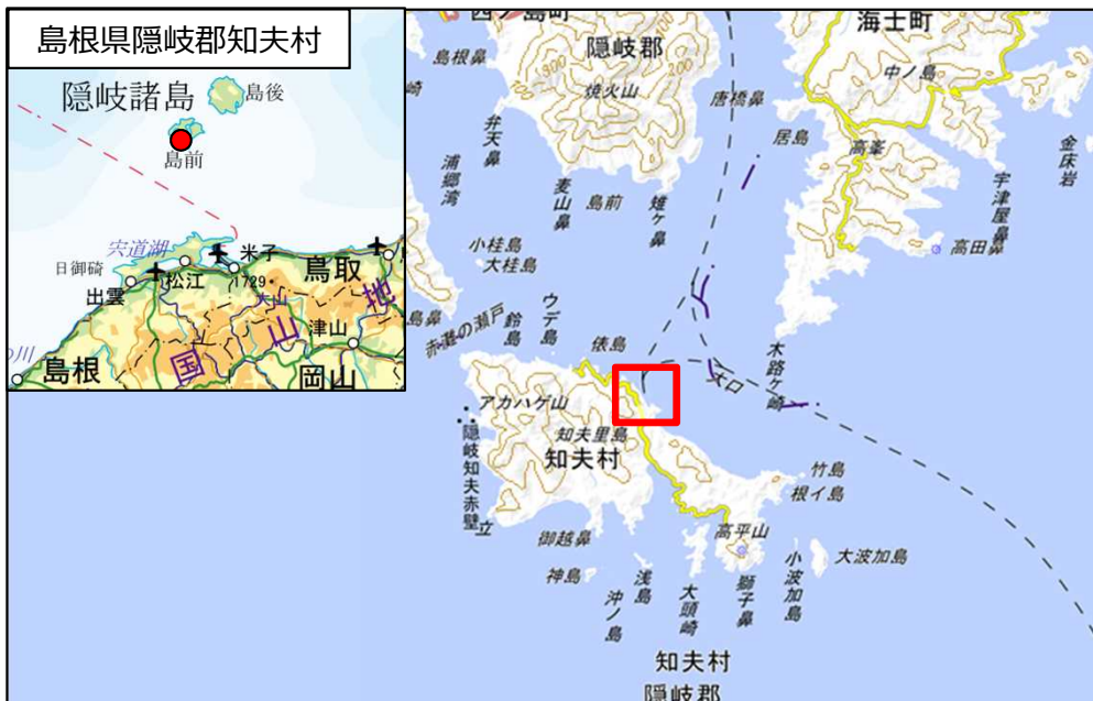
国土地理院地図（電子国土Web）( http://maps.gsi.go.jp )をもとに国土交通省作成