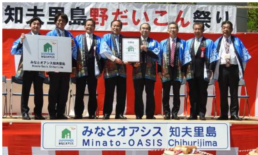
登録証交付式関係者による記念撮影

※「みなとオアシス」とは、地域住民の交流や観光の振興を通じた地域活性化に資する「みなと」を核としたまちづくりを促進するため、住民参加による地域振興の取組みが継続的に行われる施設として国土交通省が申請に基づき登録する制度です。