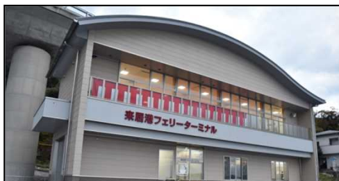
来居港フェリーターミナル