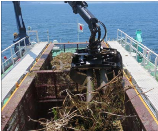
海面浮遊ゴミ回収状況