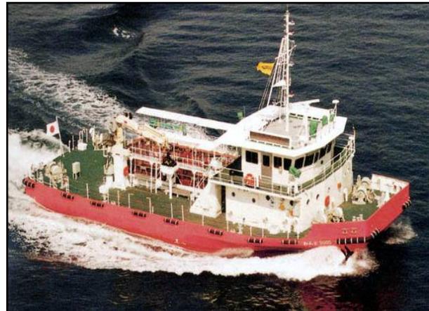
海面清掃船「おんど2000」