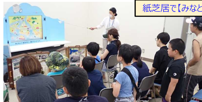
紙芝居で【みなと】の勉強