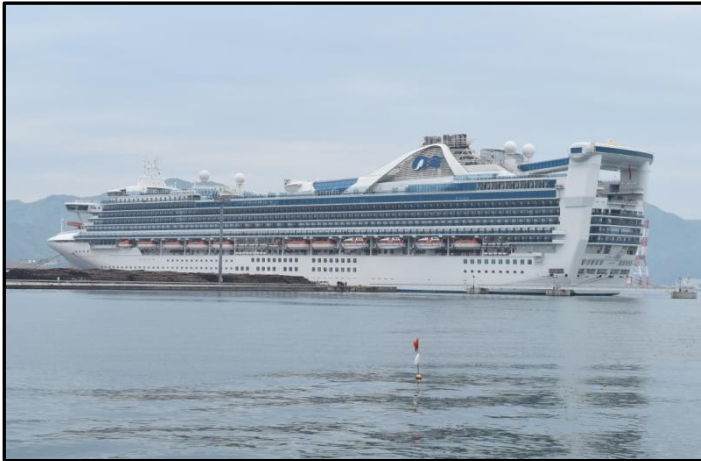
境港(外港中野地区)に初寄港する 「ゴールデン・プリンセス」

横浜発の欧米人客を中心とした約2,600人の乗客は寄港地ツアーなど山陰観光を楽しみました。