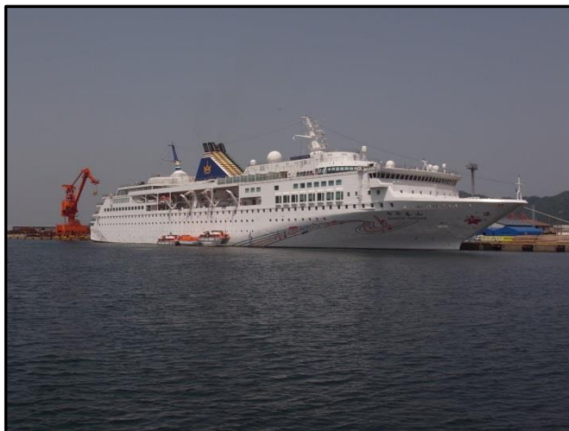
境港(外港昭和南地区)に着岸する 「チャイニーズ・タイシャン」

大連発の中国を中心とした乗客は、松江城や水木しげるロードなどの観光を行いました。