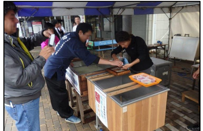
紙すき体験の様子