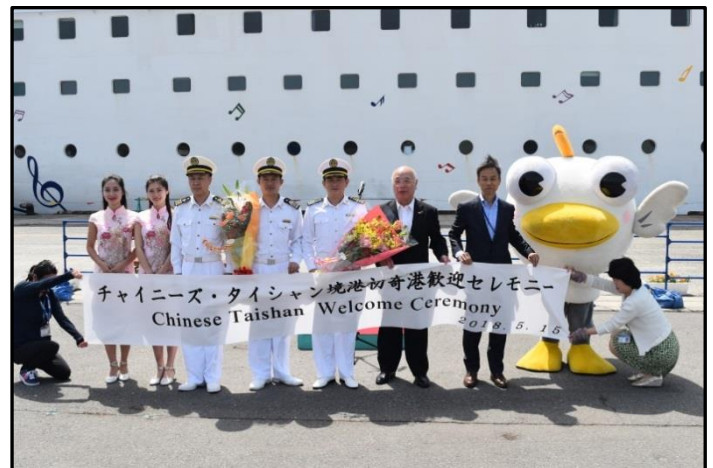
中村境港市長(右から2番目) 記念撮影の様子