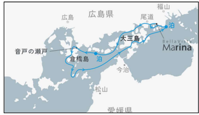
10/8、19[中央航路4] 上蒲刈島沖・鞆浦沖錨泊 3日間