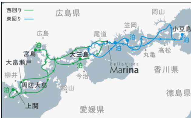
10/25 暮らすように旅する瀬戸内周遊 6泊7日間