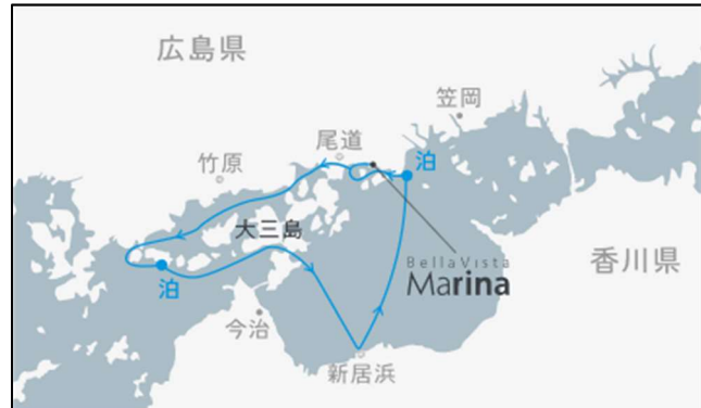
10/17[ガンツウ1周年記念航路] 瀬戸内の魅力再発見 2泊3日間