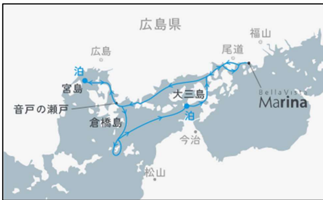
10/21[西回り] 宮島沖・大三島沖錨泊 3日間