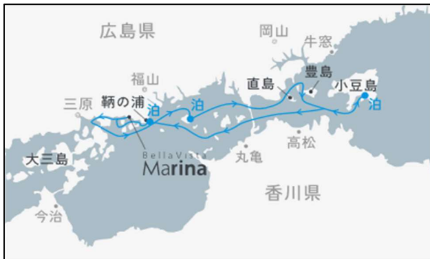
10/10、28[東回り] 北木島沖・小豆島沖・鞆の浦沖錨泊 4日間 10/28[東回り] 北木島沖・小豆島沖・錨泊 宇野港下船 3日間