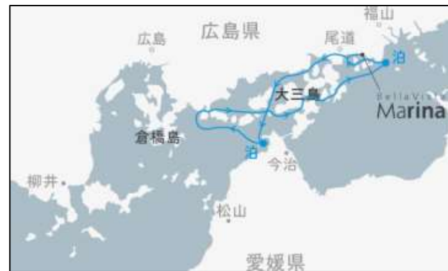
10/23[中央航路2] 波方沖・鞆の浦錨泊 3日間