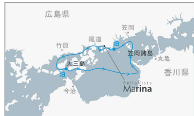
10/31[中央航路1] 大三島沖・鞆の浦沖錨泊 3日間