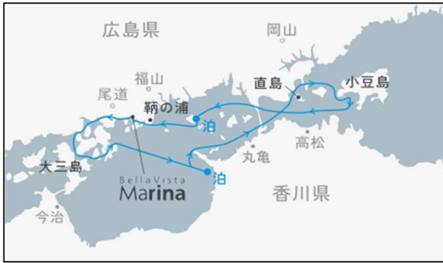
10/6[特別航路8] 仁尾沖・北木島沖錨泊 3日間