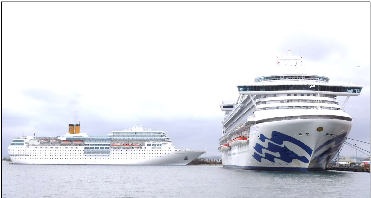
二隻同時寄港する「コスタ・ネオロマンチカ」(写真左)と「ダイヤモンド・プリンセス」(写真右)

「ダイヤモンド・プリンセス」は今回が、また「コスタ・ネオロマンチカ」は8月14日が境港への今年最後の寄港となりました。