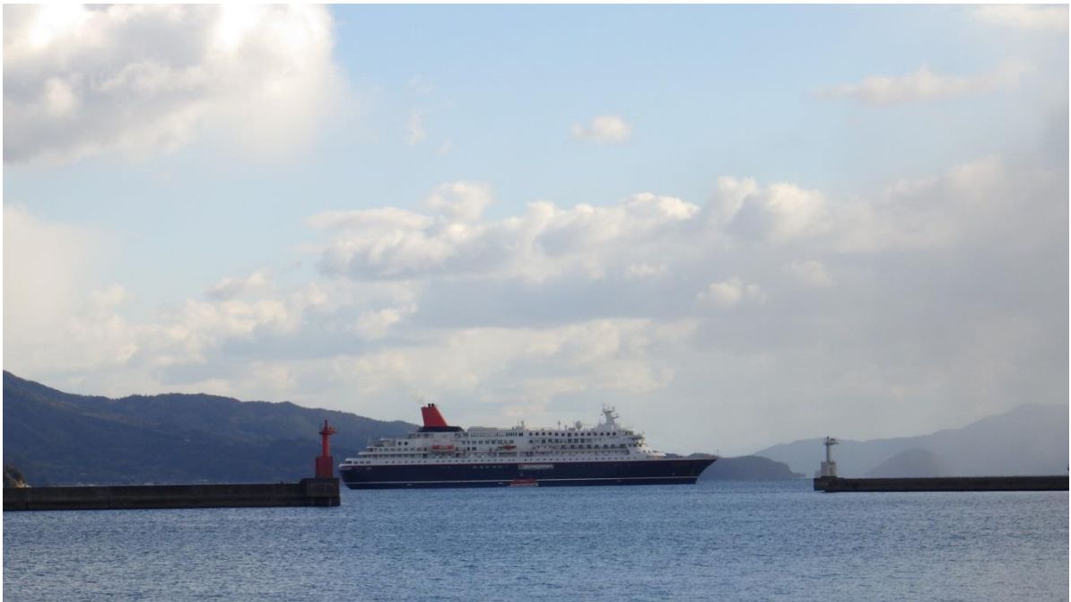
柳井港沖合に停泊するにっぽん丸

同港では柳井市観光おもてなし協議会により、摘香ミカンでつくる特産品「橘香酢（きっかす）」を使ったホットドリンクの配布やカーネーションによるフラワーゲートも作成され、乗客の歓迎が行われました。