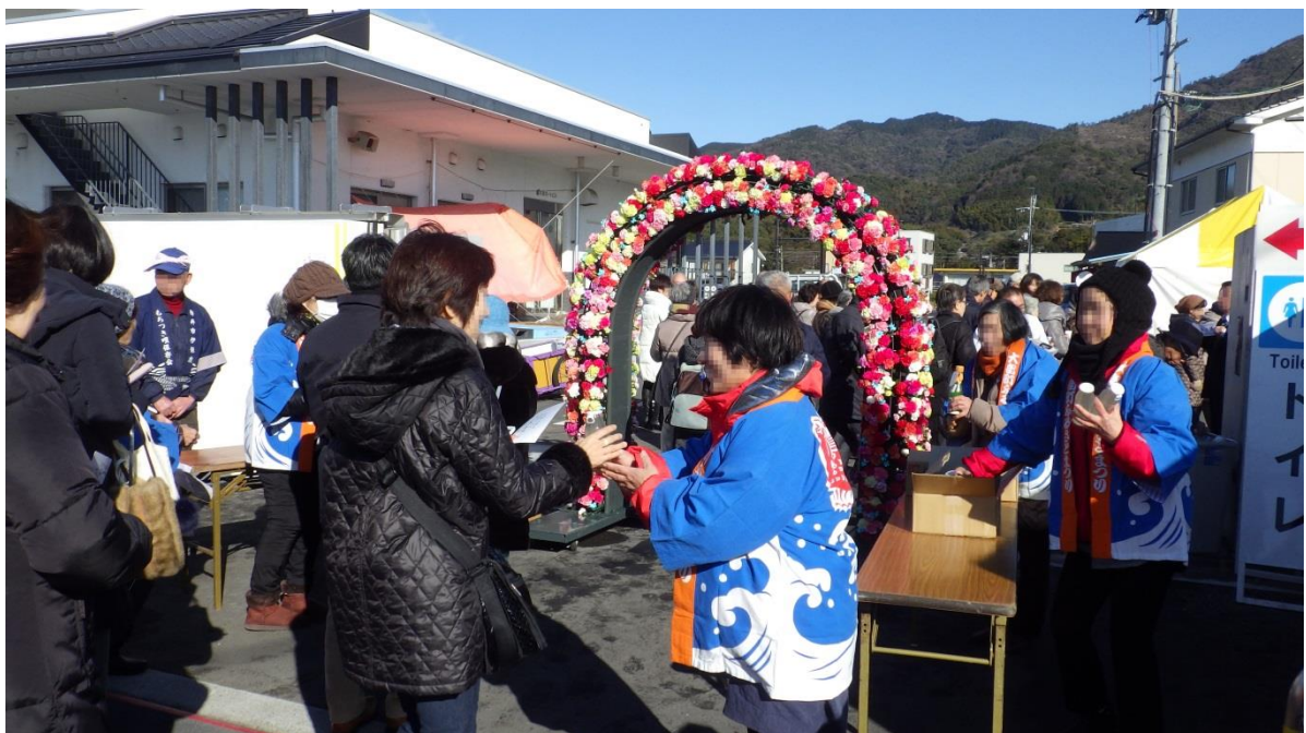
歓迎状況（橘香酢ホットドリンク配布、フラワーゲート）