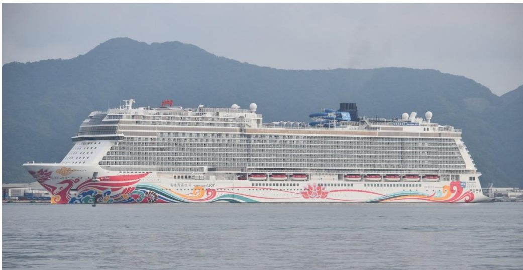
ノルウェージャン・ジョイ（境港）

乗客のうち約2,400人が60台のバスに乗り、島根県松江市、鳥取県北栄町、境港市の水木しげるロードなどで観光を行いました。