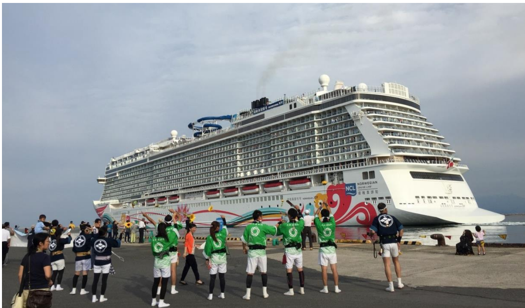
岸壁での寄港歓迎の様子