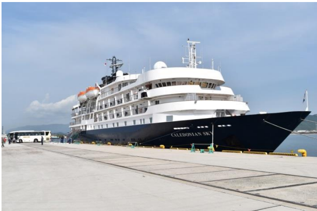
カレドニアン・スカイ