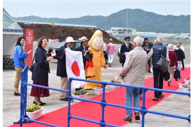
ブレーメン入港歓迎の様子