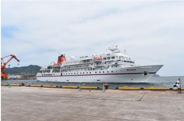
境港に初寄港したブレーメン

また、同日、イギリスのノーブル・カレドニア社が運航する「カレドニアン・スカイ」(総トン数4,200トン)、フランスのポナン社が運航するロストラル(総トン数10,700トン)も寄港を行い、3隻同時寄港となりました。